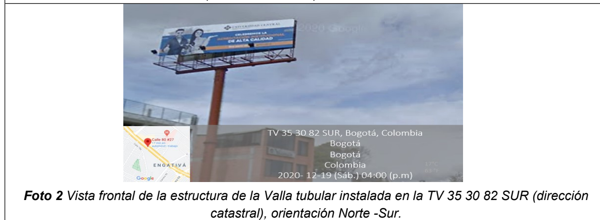
Foto 2 Vista frontal de la estructura de la Valla tubular instalada en la TV 35 30 82 SUR (dirección catastral), orientación Norte -Sur.